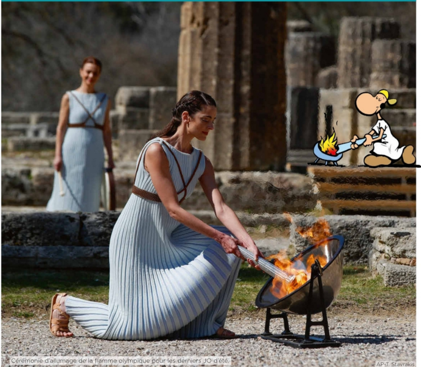
Cérémonie d'allumage de la flamme olympique pour les derniers JO d'été.

La flamme qui brûlera pendant les Jeux olympiques, cet été à Paris, sera allumée mardi, puis elle VOYAGERA pendant plusieurs mois