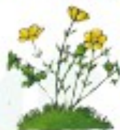
le bouton d'or