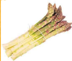
Une botte d'asperge

Au potager , c'est le moment de planter les variétés précoces de pommes de terre , d'ail rose , d'oignon blanc , d'échalotes , d'asperges , de petits pois et de fraisiers ..