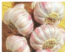
De l'ail rose

Au potager , c'est le moment de planter les variétés précoces de pommes de terre , d'ail rose , d'oignon blanc , d'échalotes , d'asperges , de petits pois et de fraisiers ..