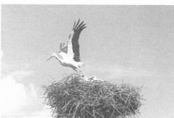
Nid de cigogne