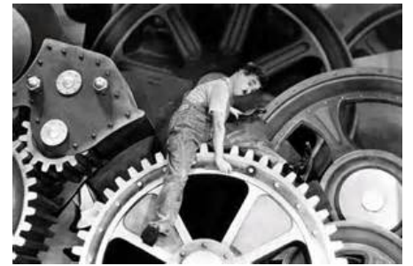
Les temps modernes