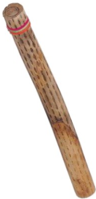
un bâton de pluie