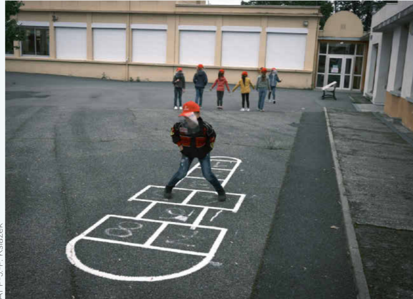
R. Botte AFP-J.P. Ksiazek