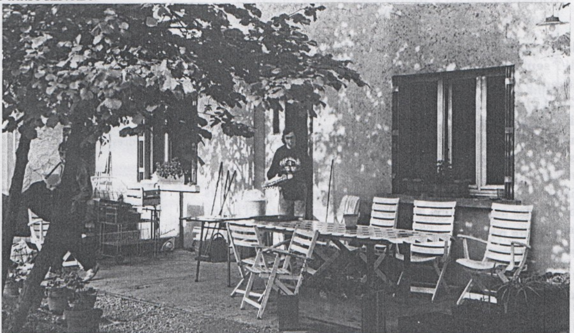
A Epernay, la terrasse est accueillante...

Le sous-sol du bric à brac est vidé et ouvert à la vente des meubles. Le grand événement de ce mois a été la réunion du sous-groupe chez nous. Nous avons apprécié d'accueillir pour presque deux jours sept membres du groupe Fraternité (voir article dans le prochain N°). Depuis, nous avons accueilli trois nouveaux compagnons.