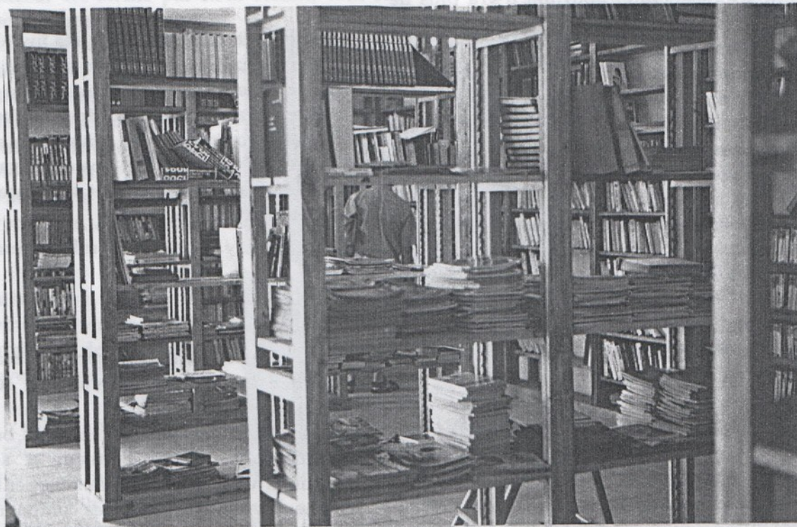
superbes rayonnages à Poitiers...

Le départ est prévu pour le 19 juillet. Un compagnon part avec un véhicule de la communauté passer trois semaines en Roumanie en compagnie d'un groupe de personnes de la Halte, centre d'accueil de la Roche sur Yon, pour retaper une école. Départ le 26 juillet! On a lancé un appel financier pour aider à construire notre bric à brac aux Essarts. On aimerait bien avoir les réponses (même négatives) maintenant, même si les fonds n'arrivent qu'en septembre ou octobre.