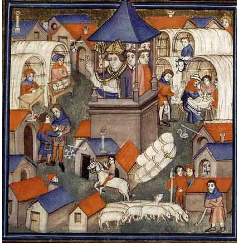
Miniature représentant la bénédiction de la foire du Lendit dans un pontifical (livre liturgique qui contient les cérémonies propres à l'évêque) du milieu du XVe siècle

Que voit-on comme marchandise sur les illustrations?