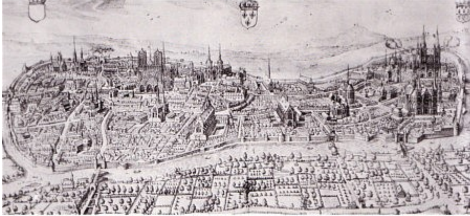
Reims - vue générale Bibliothèque nationale - Est.Va 105.)

Reims a été une des dernières villes à élargir ses remparts pour y inclure les faubourg. En t'aidant du plan ci-dessous, repasse les remparts sur le plan actuel de Reims.