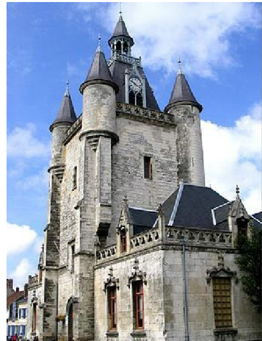
Beffroi de la ville de Tournai

Notes : Le tonlieu est une taxe perçue sur la vente des marchandises ; le minage est un droit perçu sur les récoltes de froment ; le forage est un droit perçu sur la vente de vin ; la taille est un impôt sur les personnes.