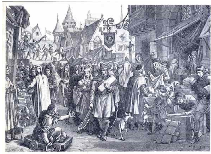
Une foire en Champagne au XIII e siècle.