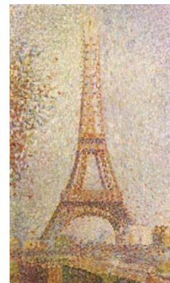
Seurat - 1889