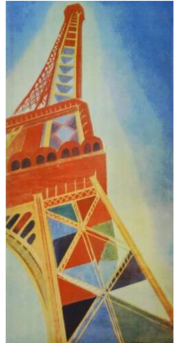
Robert Delaunay, La Tour Eiffel , 1926 Huile sur toile, 169 x 86 cm