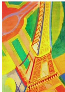
Delaunay - 1926

Delaunay représente ici la tour Eiffel vue d'en bas, depuis le pied de l'un des quatre piliers. C'est ce que l'on appelle une perspective en contre-plongée. Le cadrage en gros plan et le format de la toile prise dans le sens de la hauteur permettent de mettre en valeur l'aspect monumental de la tour. Le peintre joue avec les couleurs vives et les formes géométriques créées par les structures métalliques. Le dégradé du ciel autour de la tour crée un halo de lumière qui l'accompagne sur toute sa hauteur.