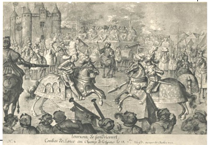
Combat de lance au Champ de la Paine le 18. 7. 1450. d'après Charles V. 11.