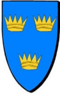
le roi Arthur