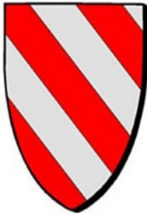
Lancelot du Lac