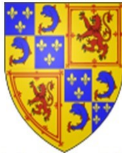
François II, dauphin, roi d'Écosse puis roi de France