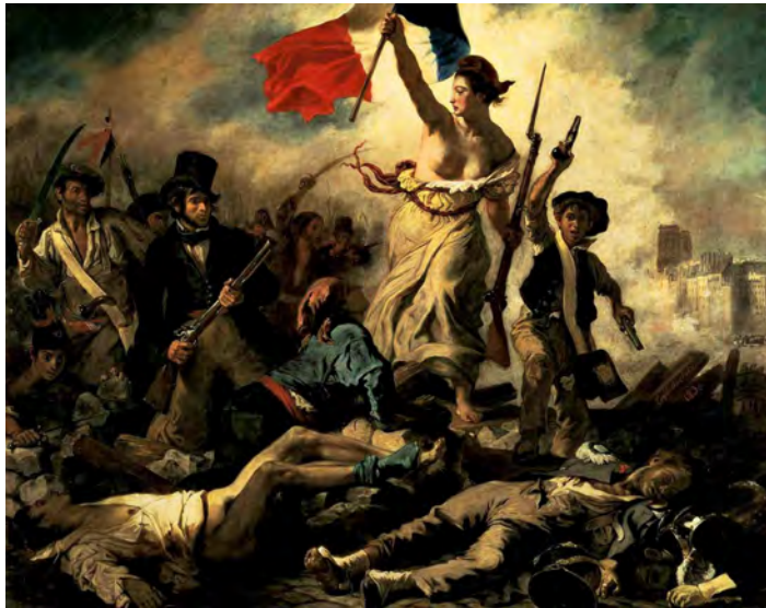
Doc.1 La liberté guidant le peuple. Eugène Delacroix, 1830. Musée du Louvre

Après l'exil de Napoléon Bonaparte, les pays qui ont vaincu Napoléon imposent le retour du roi Louis XVIII , frère de Louis XVI sur le trône de France. Une Charte promulguée par le Roi reconnaît les principales libertés et l'égalité des Français. A côté du Roi qui gouverne, deux assemblées limitent son pouvoir. Mais seuls, les riches propriétaires ont le droit de voter et de se faire élire députés. Le drapeau blanc de la royauté remplace le drapeau tricolore.