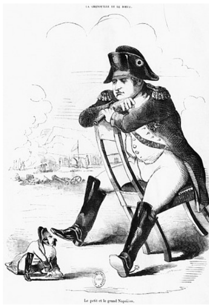
Doc.3 La grenouille et le bœuf.

Le gouvernement de Louis Philippe est plus libéral que celui de Charles X. Le drapeau tricolore remplace le drapeau blanc. Des lois utiles sont votées : construction obligatoire d'une école par commune, décision de construire les grandes lignes de chemin de fer. Mais le peuple demande le suffrage universel* ou droit de vote pour tous. Le Roi refuse. Paris se soulève : la Révolution de 1848 chasse Louis Philippe. Ce sera le dernier roi de France.