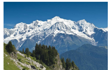
Mont Blanc 4807m (Alpes)