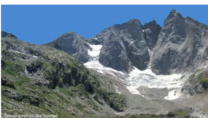
Vignemale 3298m (Pyrénées)