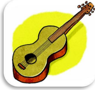
une g uitare