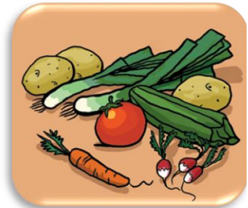
des l égumes