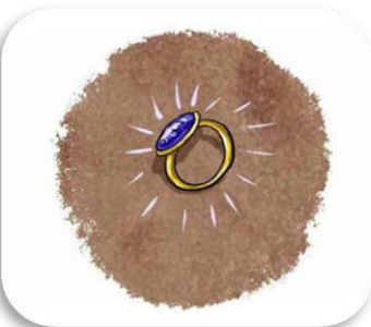
une g ague