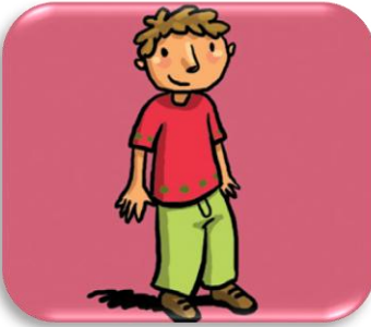
un g arçon

J'écris aussi g devant a, o ou u Ou j'écris aussi gu devant e ou i .