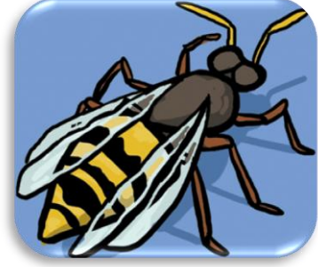
une g uêpe