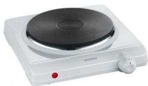
une plaque de cuisson