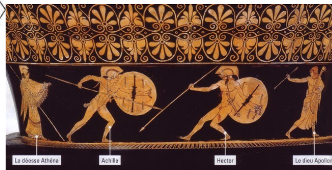
Un vase grec du V e s avt JC, et l'affiche du film Troie (2004)