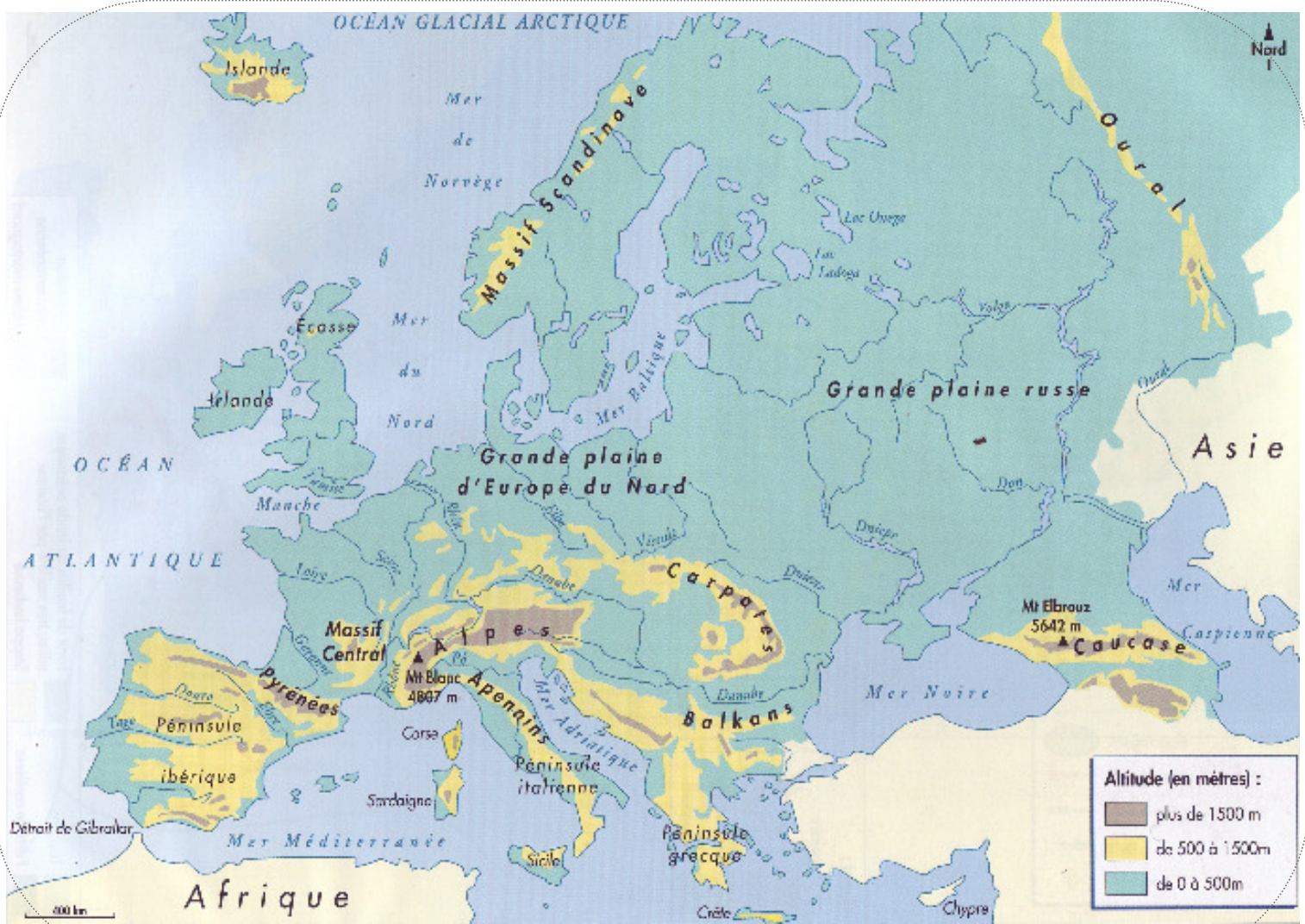
1. Le relief en Europe.