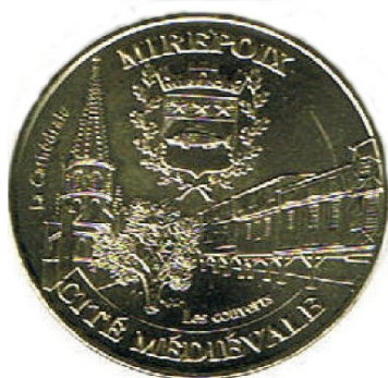
Mirepoix Cité Médiévale