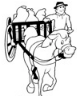
le cheval et sa charrette