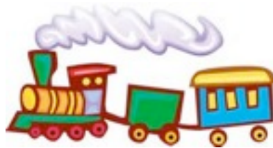
la locomotive et les wagons du train