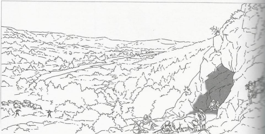
▼ Reconstitution de la grotte habitée par les hommes de Tautavel

Un illustrateur a représenté l'entrée de cette grotte en respectant les informations données par l'archéologue. Voici son dessin :