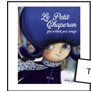
Textes 1 à 3

1 - Réponds aux questions en faisant des phrases correctes