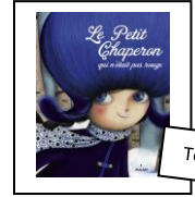
Textes 12 et 13