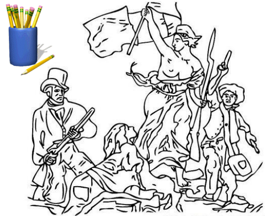
« La Liberté guidant le peuple », Eugène Delacroix, 1830.