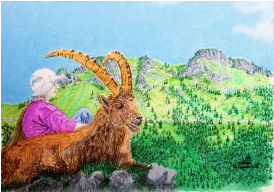
Pastel sur Arches LM