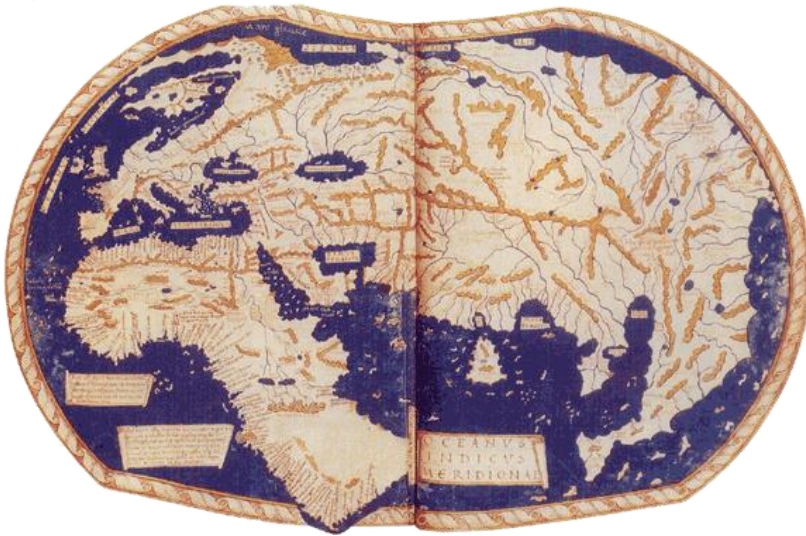
Portulan du monde connu 1489