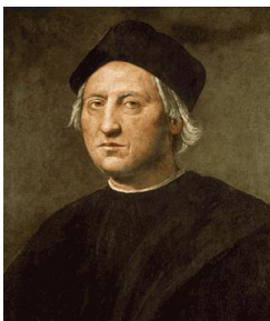
Christophe Colomb 1451-1506

Un navigateur italien, Christophe Colomb pense que la terre est ronde et qu'il est donc possible d' atteindre les Indes par l'Ouest . Or, si l'Inde figure bien sur les cartes maritimes de l'époque, l'Amérique est encore inconnue. Il embarque donc le 3 août 1492 , à la tête d'une armada forte de trois caravelles au service de la reine d'Espagne. Il mettra 3 mois avant d'apercevoir une terre qu'il prendra pour l'Inde. En réalité, il vient de découvrir un nouveau Monde alors inconnu, l'Amérique .