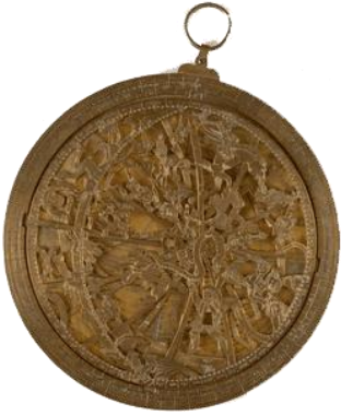
Astrolabe du XVI e Siècle

Les routes maritimes au Moyen Âge étant mal connues et les instruments de navigation peu précis , les marins ne s'aventuraient jamais en plein océan et se contentaient de longer les côtes. Depuis le XIII ème Siècle l'acheminement des denrées très prisées en Europe comme la soie, l'or ou les épices , venues d'Orient s'effectue par voie terrestre. Mais la route est longue et périlleuse rendant ces marchandises très chères. Les navigateurs portugais et espagnols cherchent donc de nouvelles routes maritimes afin de rejoindre les Indes.