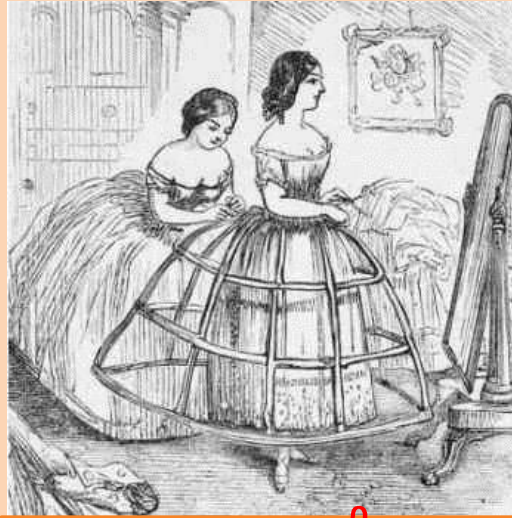
robe à crinoline