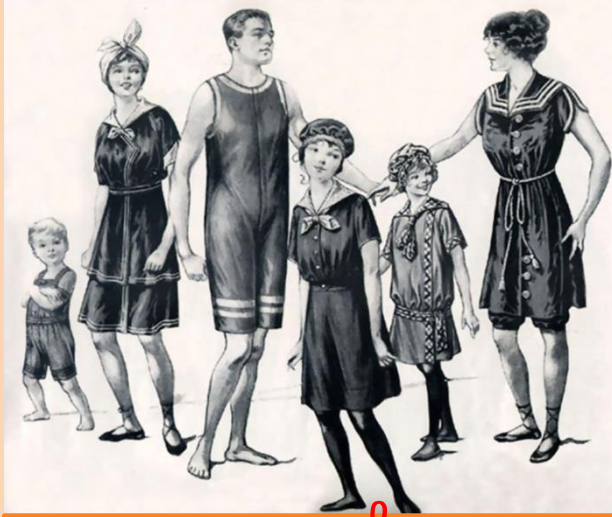
costume de baignis