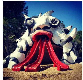
Le jardin des tarots