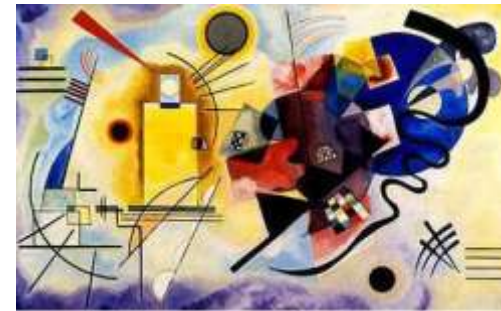
Jaune rouge bleu - 1925

Il reste le père de l'abstraction et a annoncé l'expressionnisme abstrait.