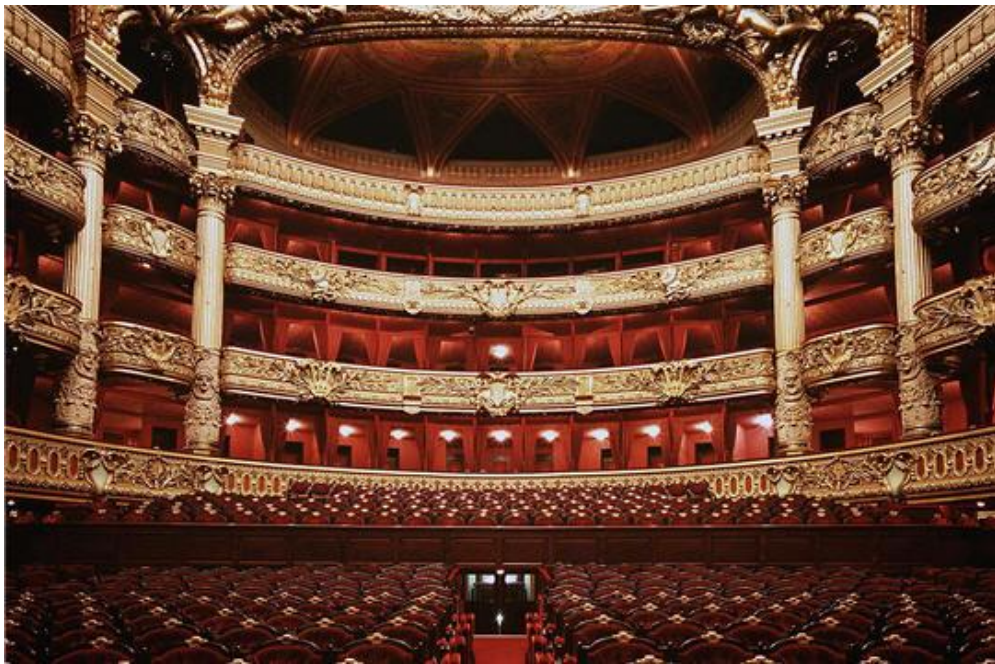
La salle de spectacle