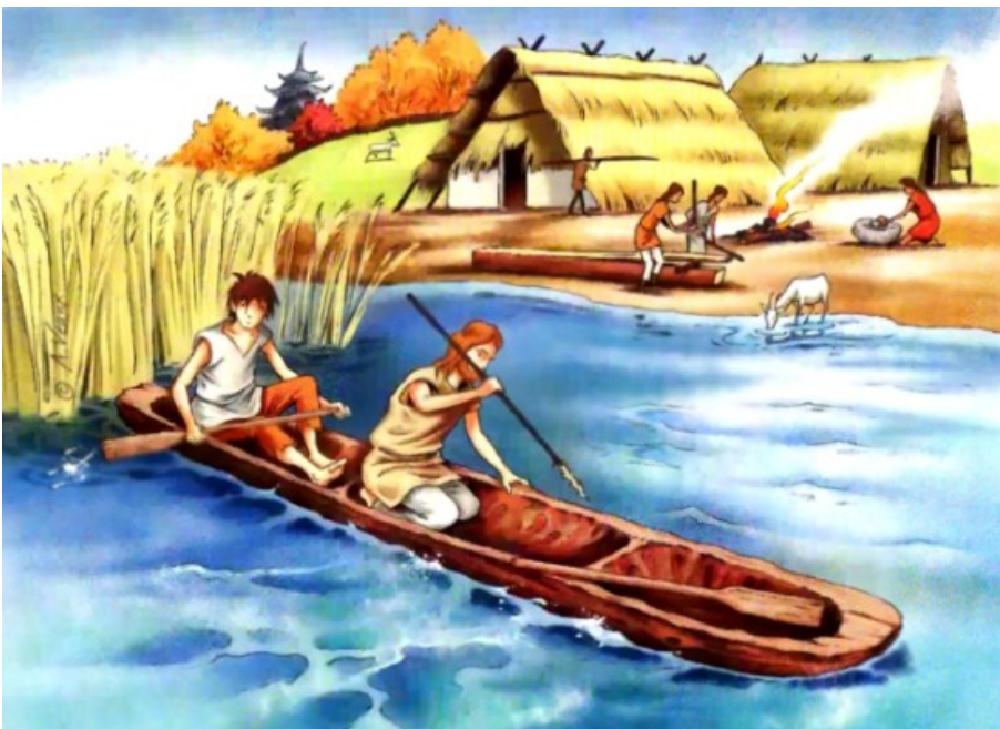
Le déplacement en pirogue

À la fin de la préhistoire, les hommes deviennent sédentaires et s'établissent dans des campements fixes. Ils choisissent souvent de s'installer près des lacs ou des rivières. Ils inventent alors la pirogue pour se déplacer sur l'eau et pratiquer la pêche de manière efficace.