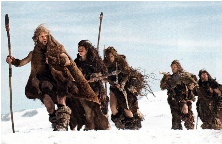
Le déplacement à pied d'un lieu de chasse à l'autre Image extraite du film de Jacques Malaterre, Ao, le dernier Néandertal , 2010

Les premiers hommes sont nomades. Sans habitation fixe, ils se déplacent à pied par groupes entiers pour trouver des zones de chasse et fuir des conditions météorologiques trop rudes. Ils portent alors leur nourriture et leur matériel dans leurs bras ou sur leur dos. Progressivement, ils se servent de la force animale pour transporter leurs affaires. Des bêtes, comme l'âne puis le cheval et le bœuf, sont dressées pour seconder la force de l'homme.