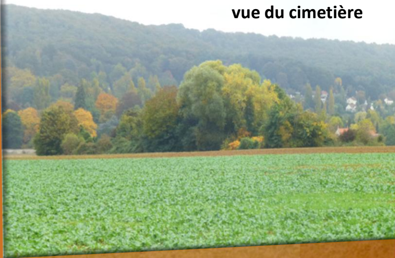
La plaine de Jouars vue du cimetière