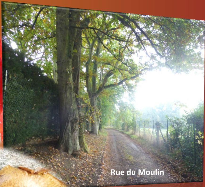
Rue du Moulin