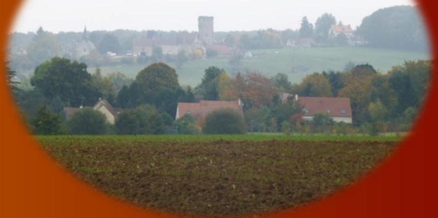
La tour de Maurepas dans la brume