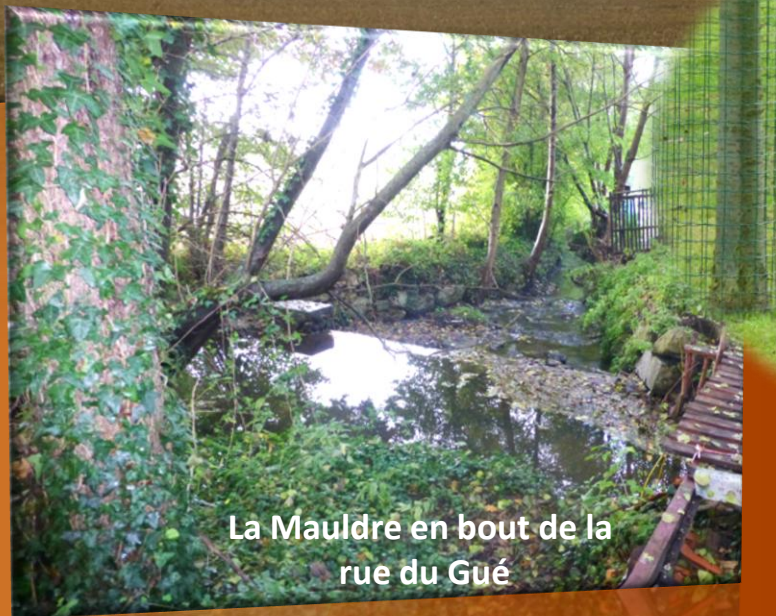
La Mauldre en bout de la rue du Gué