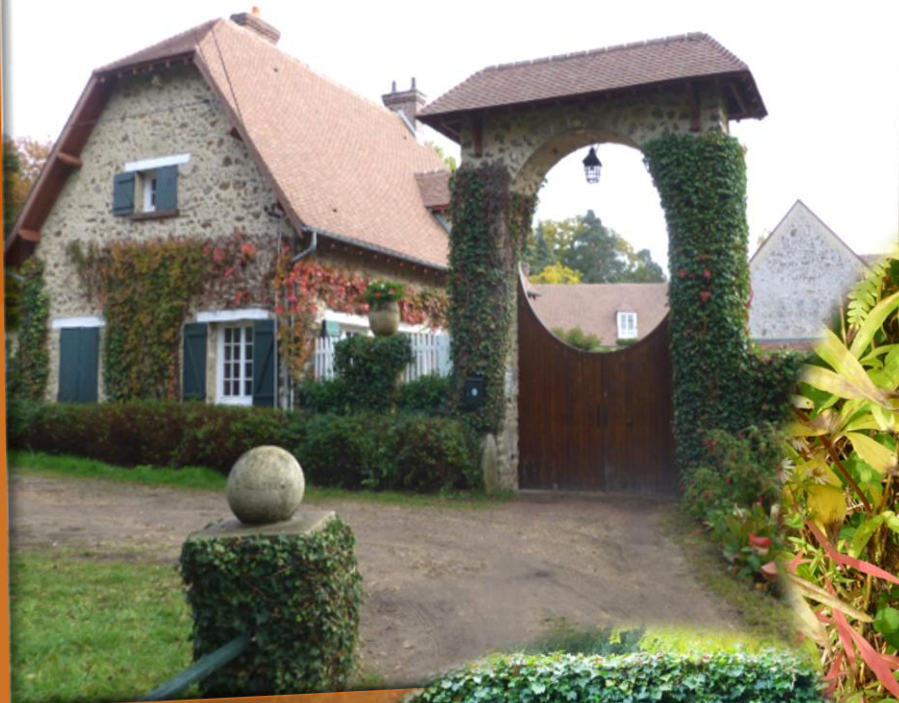
Moulin de Barre