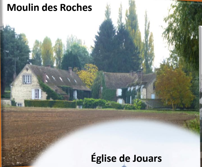
Moulin des Roches