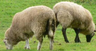
Chemin du Bourg Vallée