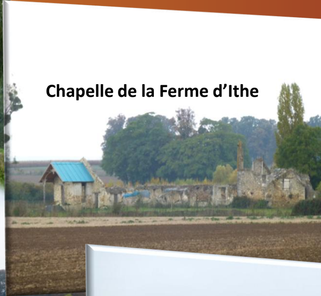
Chapelle de la Ferme d'Ithe