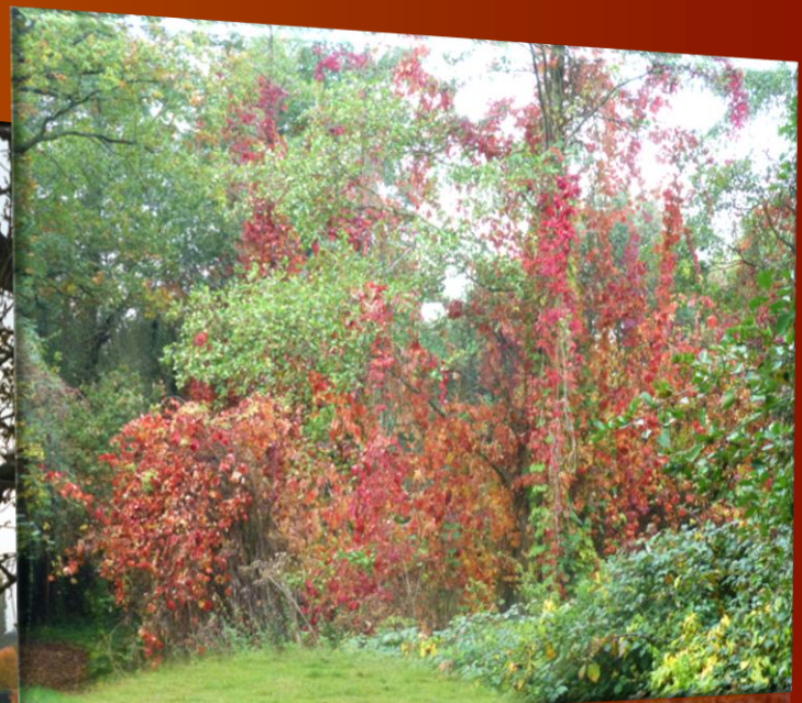
Têtes bêches !