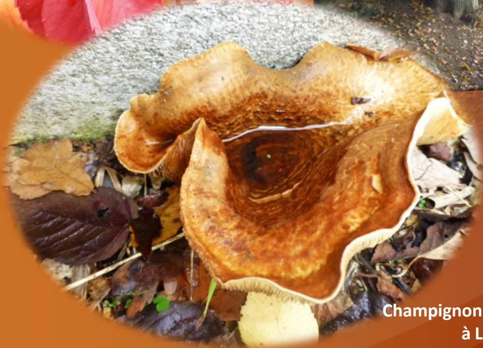
Champignon en forme de bénitier à La Dauberie