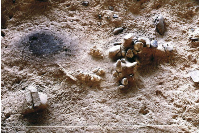
Vestiges trouvés à Terra Amata (près de Nice).

A l'aide des documents, rédige une trace écrite.