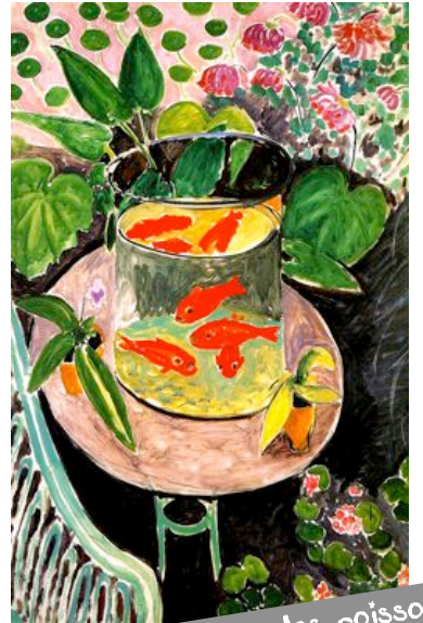
Henry Matisse : les poissons rouges