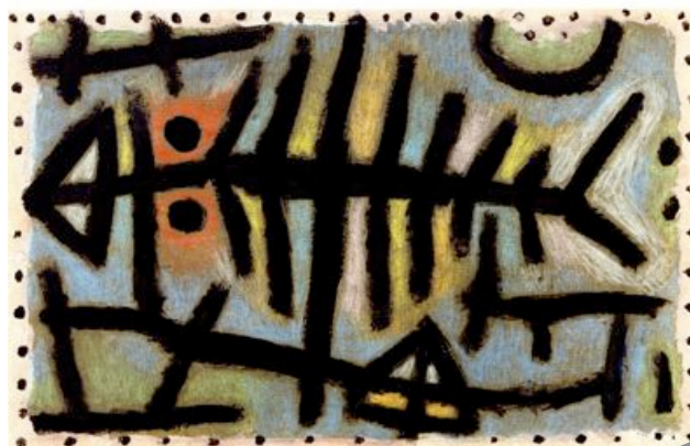
Paul Klee : le poisson cloporte