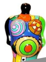
Nicki de Saint Phalle