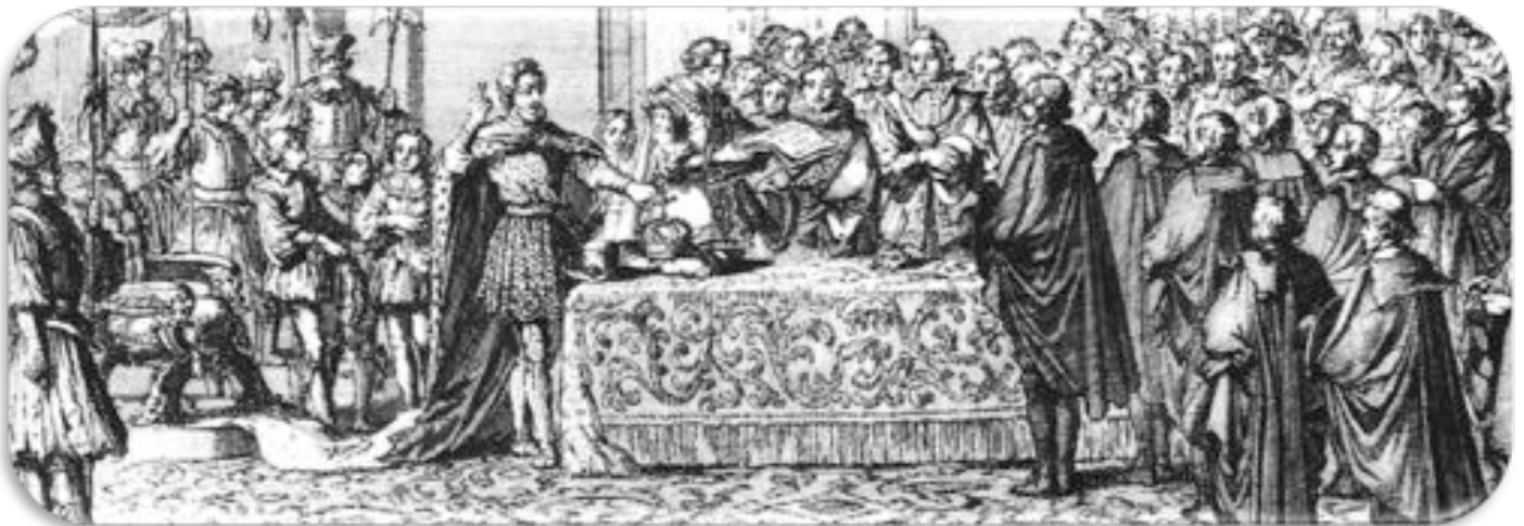
Signature de l'édit de Nantes en 1598.

Le roi, ses ministres et des représentants des deux religions