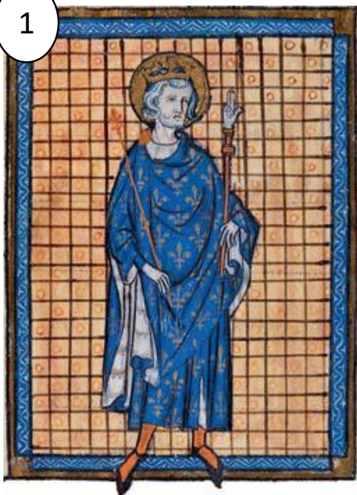
Louis IX dit Saint-Louis avec des objets royaux. Enluminure extraite du Registre des ordonnances de l'Hôtel du roi, fin du XIII ème siècle

Louis IX (Louis 9) a été roi de France au XIII ème (13 ème ) siècle. Il s'est fait sacrer à Reims pour affirmer que son pouvoir lui venait de Dieu. Il n'exerçait son autorité que sur le domaine royal.