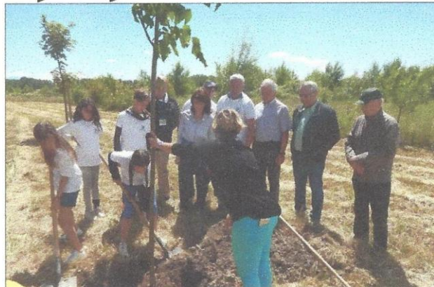
Les conseillers municipaux enfants ont joué de la pelle pour planter un tilleul.