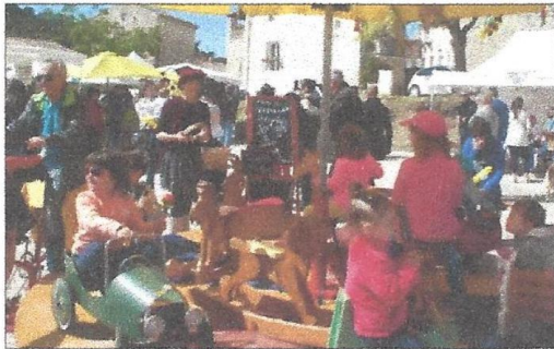
Les enfants se sont bien amusés.

Fabrication de bombes à fleurs, ateliers autour de la laine et fabrications d'abeilles