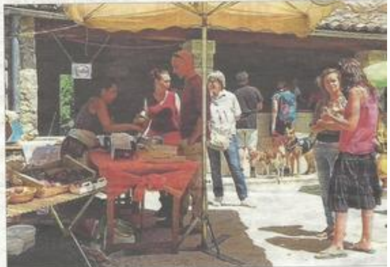
Le marché de producteurs.