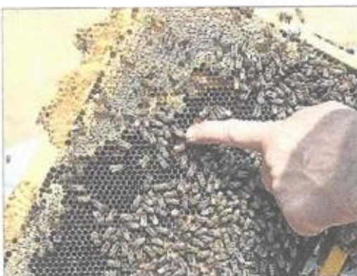
■ Miel, propolis... des produits bénéfiques pour la santé.

Une relation qui a commencé voilà plusieurs milliers d'années. « Des écrits chinois vantaient déjà les produits de la ruche voilà plus de deux mille ans. De tous temps, les bienfaits des produits de la ruche étaient connus de l'homme », raconte Kevin Titecat. Les Égyptiens ont mis sur pied le procédé de momification en observant les abeilles qui embaument les insectes indésirables qui pénètrent dans la ruche. « Il y a énormément de choses que l'humain a appris juste en observant les abeilles. » Ainsi, leur miel se révèle très efficace pour les plaies et brûlures. Le pape Pie XII gravement malade fut