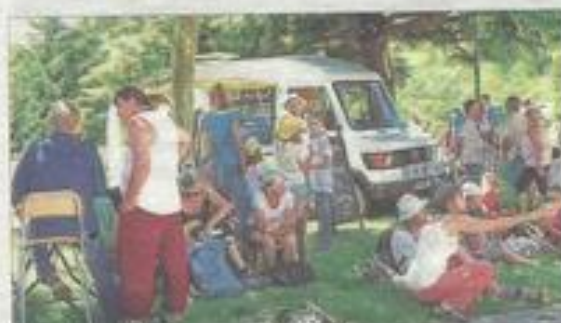
Pause bien méritée pour nos randonneurs !