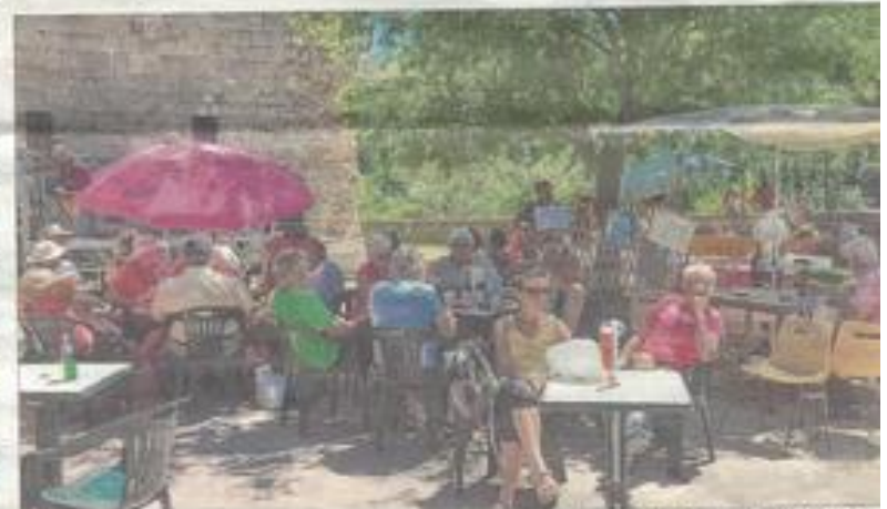
Après la randonnée du matin, les promeneurs se sont retrouvés au pied du château où était proposé l'apéro musical avec le groupe Thorne.