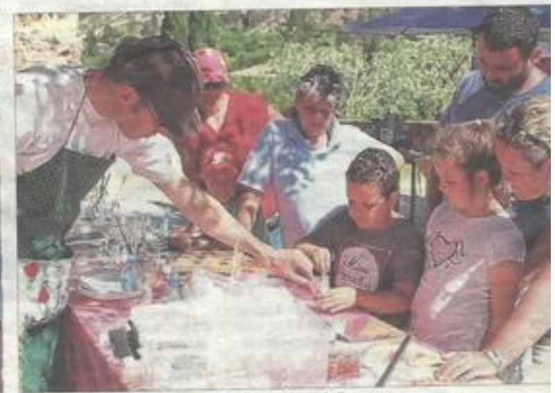
Atelier couleurs végétales par l'association Les Arômes du Tanargue.