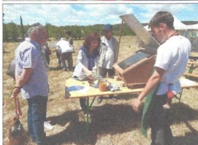
Photos de haut en bas : fabrication de la bave d'escargot et découverte des pouvoirs de cette dernière ; préparation d'une cuisson dans le four solaire.