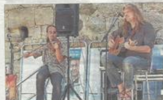
Le groupe Thorne qui a animé avec brio l'apéro musical.