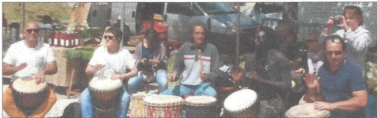
De place en place, de rue en rue, les djembés ont mis l'ambiance.

Depuis 5 ans, quand arrive le 1 mai, Saint-Restitut se transforme en ruche géante grâce à la fête de l'Abeille. Ce lundi, le soleil avait gagné sa bataille avec la pluie et c'est par un magnifique beau temps que s'est déroulée cet-