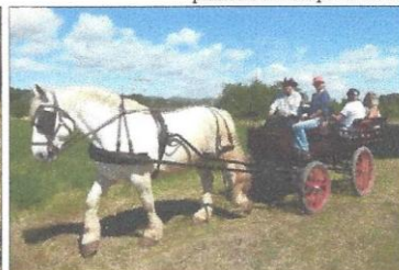
Photos de gauche à droite : découverte des animaux de la ferme pour les plus petits ; une nature à découvrir en calèche.