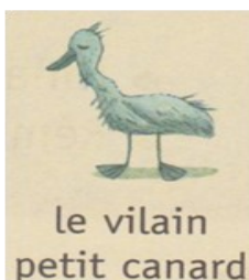
le vilain petit canard