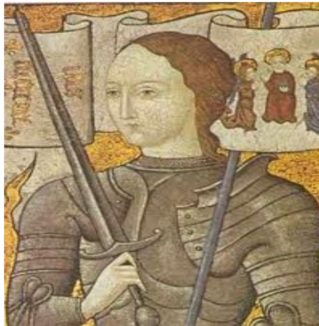
Jeanne D'Arc en armure

Par l'intermédiaire de Jean de Luxembourg, les Bourguignons remettent Jeanne d'Arc aux Anglais. Ce dernier l'avait lui-même capturée à Compiègne. Il la remet contre une somme de 10 000 livres. Les Anglais la confieront eux-mêmes à la justice de l'Eglise en assurant qu'ils la reprendront si elle n'est pas accusée d'hérésie.