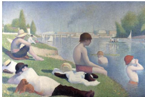
Une baignade à Asnières, 1883 - 1884