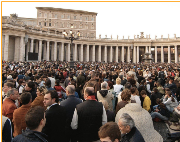
Annnonce de l'élection du pape Benoît XVI au Vatican, à Rome en 2005.

Vous allez pouvoir maintenant étudier cette image. Montrant deux événements similaires à des époques différentes.