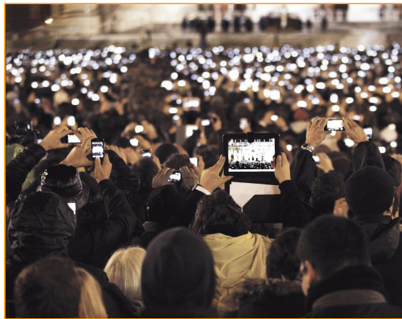
Annnonce de l'élection de l'actuel pape François I au Vatican, à Rome en 2013.

De la même manière vous allez devoir répondre à des questions, qui seront disponibles ici dans ce questionnaire. Regardez attentivement les images avant de répondre aux questions, elles seront également placées à nouveau dans le questionnaire : )