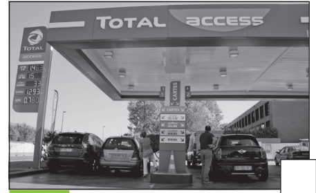
Doc. 3 Une station essence à Lyon.