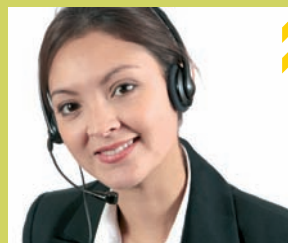
PLATE-FORME SERVICES CLIENTS ET NUMÉRO D'URGENCE