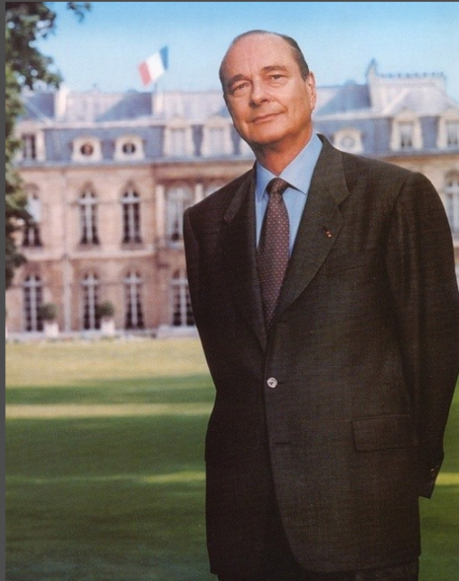
Jacques Chirac (1995-2007)

Le portrait officiel du président de la République française est réalisé au début de son mandat pour être affiché dans les bâtiments publics, notamment dans les 36000 hôtels de ville du pays. C'est une tradition républicaine qui fut inaugurée par le premier président de la IIIe République, Adolphe Thiers. Cette photo officielle a pour fonction d'incarner le pouvoir, et de symboliser une certaine conception de ce pouvoir ; ce sont donc des photos extrêmement travaillées : la mise en scène a été longuement réfléchi, chaque accessoire est soigneusement choisi et hautement significatif ; le décor, le cadrage, la pose, l'expression du visage, la lumière sont lourds de sens.