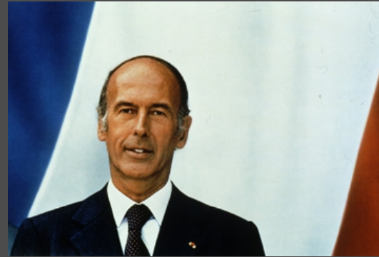
Valéry Giscard d'Estaing (1974-81)