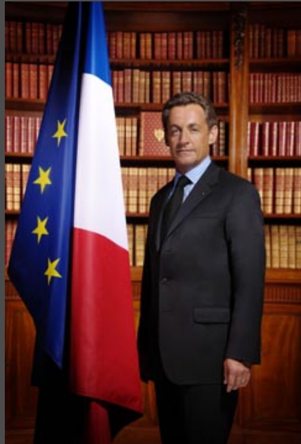
Nicolas Sarkozy (2007-12)