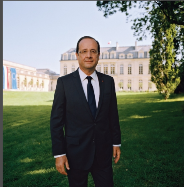
François Hollande (2012-17)