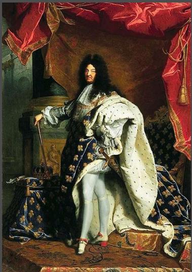
Louis XIV (1654-1715)