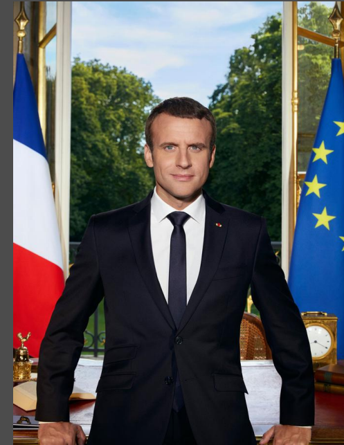
Emmanuel Macron (2017-...)