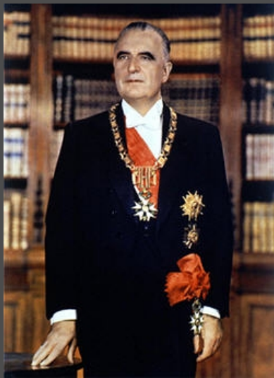
Georges Pompidou (1969-74)