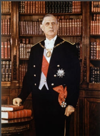
Charles De Gaulle (1959-69)