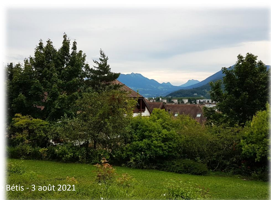
Montage d'Emérance Bétis - 3 août 2021