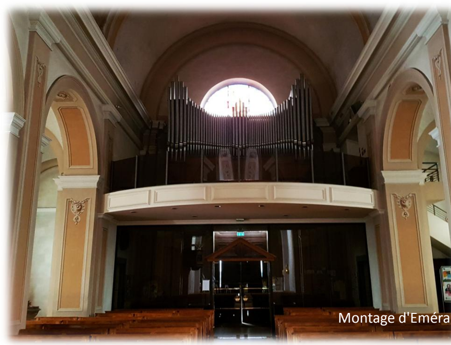
Montage d'Eméranc Bétis - 3 août 2021