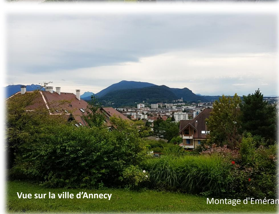
Vue sur la ville d'Annecy