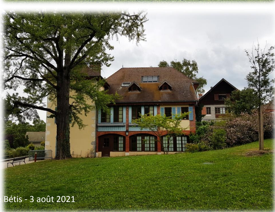
Montage d'Emérance Bétis - 3 août 2021