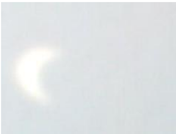
1 : Résultat obtenu à Longeville