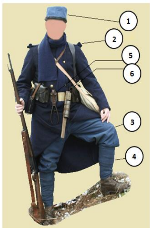
Uniforme de l'hiver 1914

baïonnette pantalon capote bidon képi jambière fusil Lebel cravate musette brodequin cartouchière