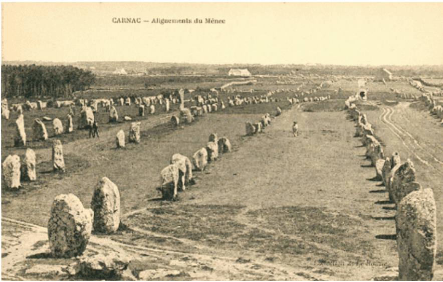
CARNAC – Alignements du Ménéac