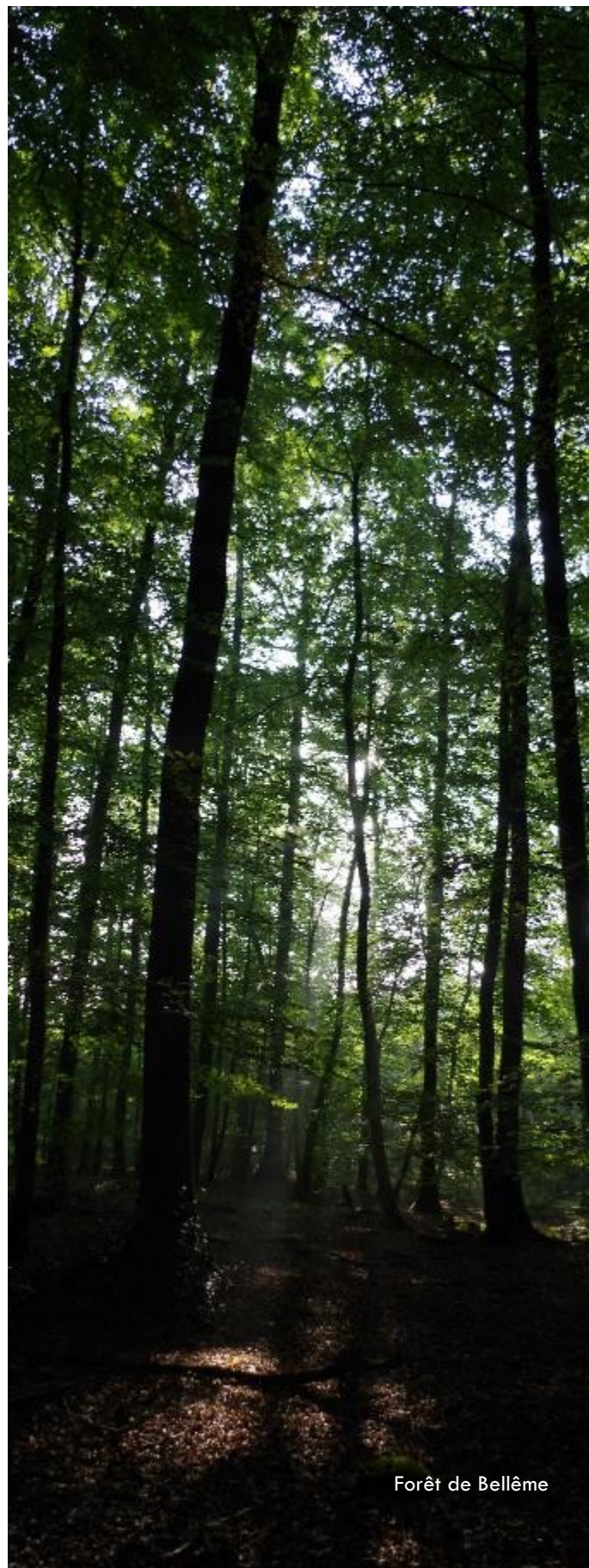
Forêt de Bellême