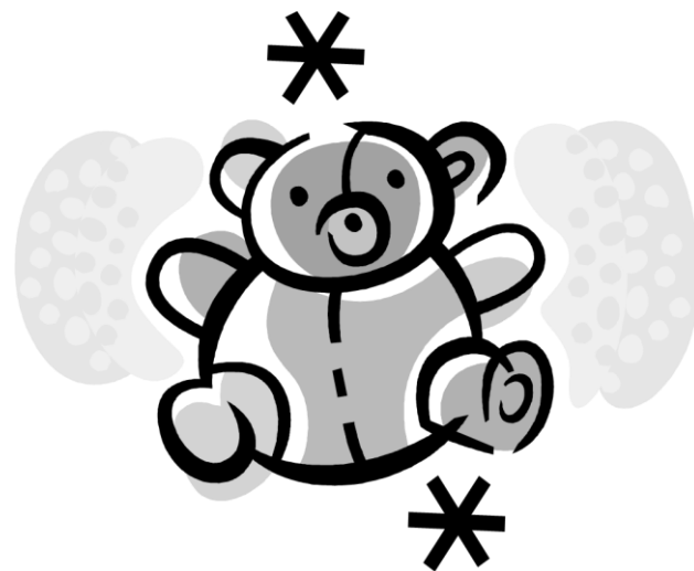
mon ours en peluche