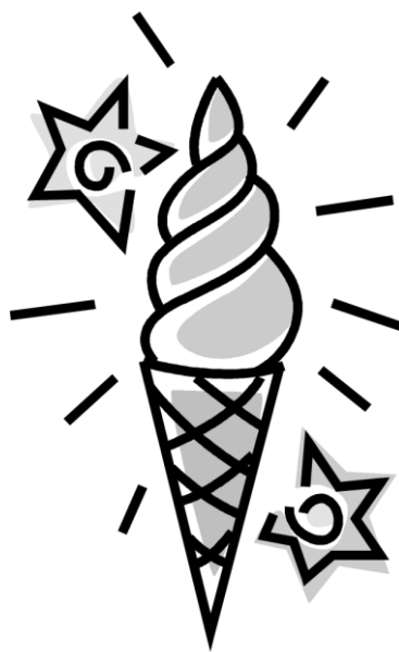
une glace à la vanille