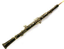
Le canard et le hautbois