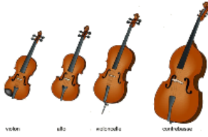
Pierre et les cordes