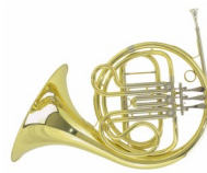
Le loup et le cor