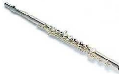
L'oiseau et la flûte