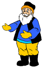
Le grand-père et le basson