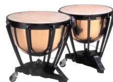
Les chasseurs et les timbales