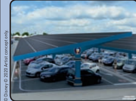
© Disney © 2020 Artist concept only.

67 500 C'est le nombre de panneaux solaires qui seront installés sur le parking de Disneyland Paris d'ici 2023 ! En plus d'être écologiques, ils feront de l'ombre aux voitures qui se gareront dessous.