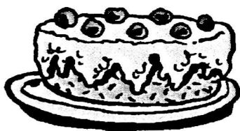
une g â teau