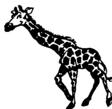
une giraf e