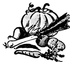
des légum e s