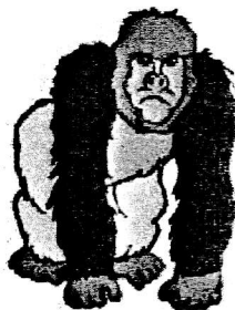
un gor il le